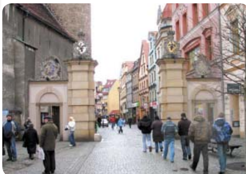
O budżecie Jeleniej Góry rozmawiamy z Zofią Czernow strona 6