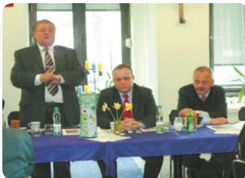
Minister Jarosław Duda z wizytą w Sejmiku strona 3